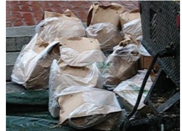
活家禽在塑料袋中挣扎。

认识到家禽市场存在着对活禽鸟的残酷虐待，并存在着对人类健康的严重威胁，城市施政管理机构已经不允许在城市直接管理的市场内（例如 Alemany Blvd 农贸市场）进行活禽兽买卖。但是政府雇用私人机构去管理 Civic Center/U.N. Plaza 农贸市场。这个独立的管理机构目前拒绝解决这些问题。