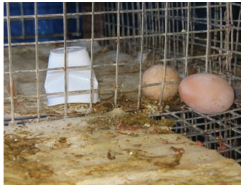
脆弱塑料杯未能提供禽鸟足够的水。

例如，活禽养殖厂的一个工人被飞行的家禽抓他的脸和眼睛。单单这些理由，旧金山大众卫生部门就应该禁止活禽兽市场。不幸的是，目前他们不情愿采取任何措施去解决这些问题。